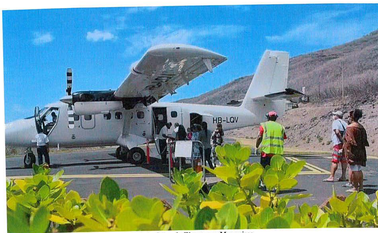
Twin Otter de Zimex aux Marquises