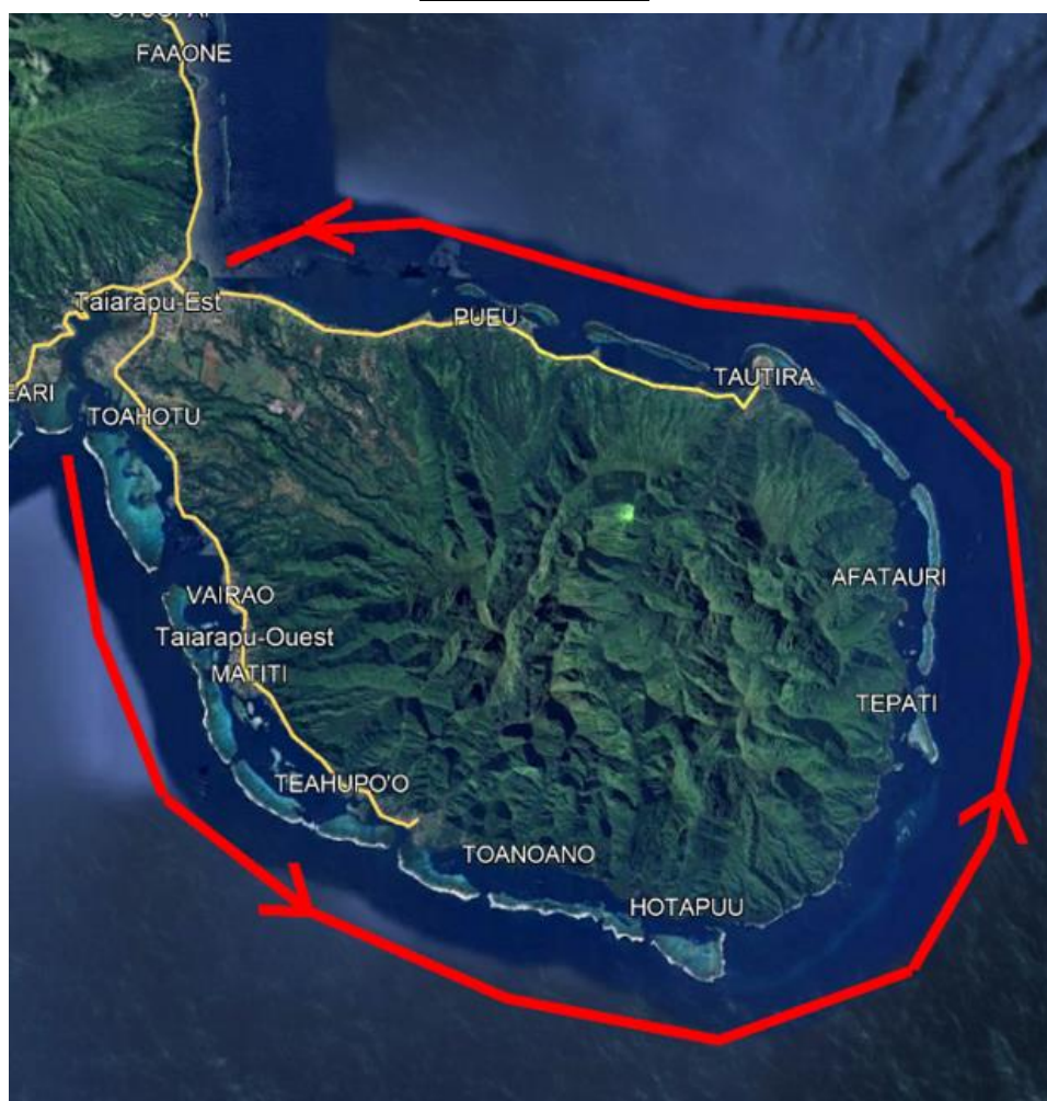
Schéma indicatif de la configuration de remorquage des sections de conduite (270m et 700m).