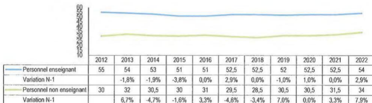
Graphique : Effectifs de personnel sur la période 2012-2022