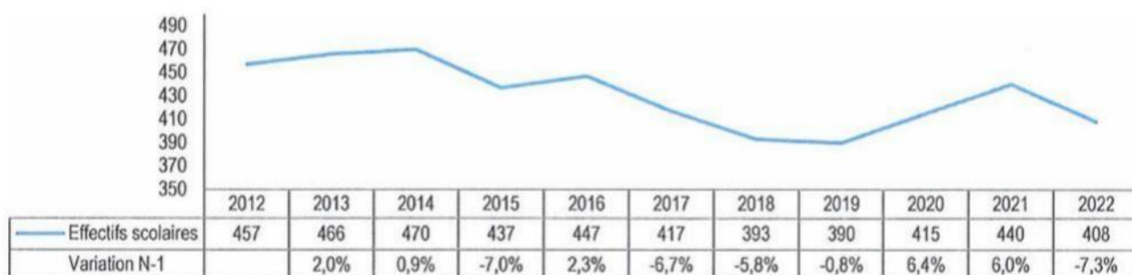
Graphique : Effectifs scolaires sur la période 2012-2022