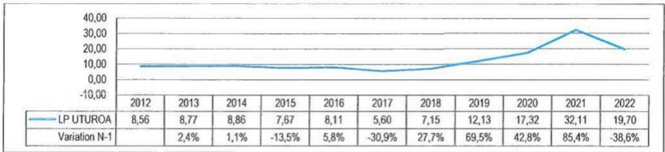
Graphique n° 4 : Fonds de roulement sur la période 2012-2022 (en millions de F CFP)