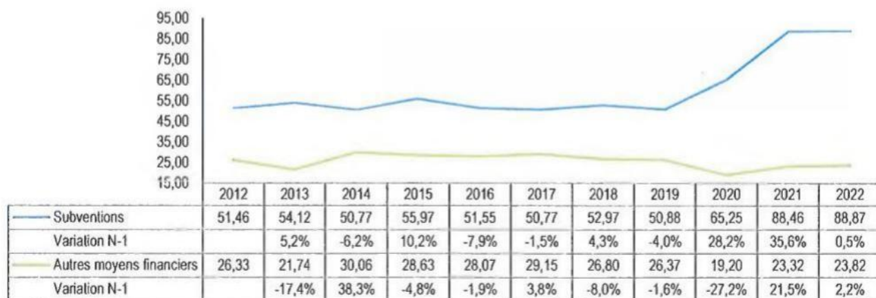
Graphique : Moyens financiers sur la période 2012-2022 (en millions de F CFP)