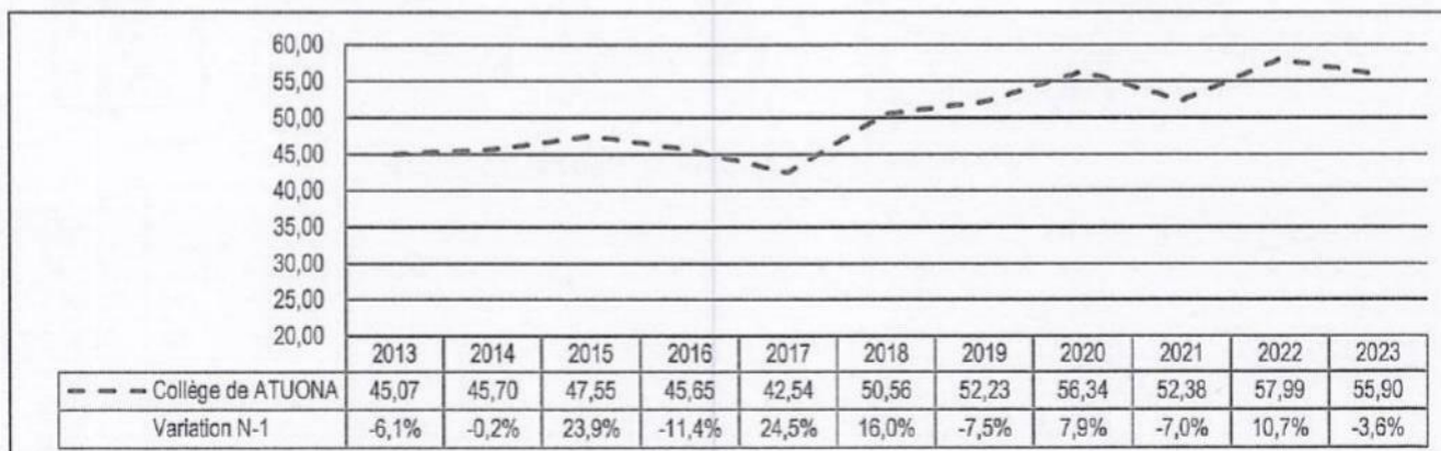
Graphique n° 3 : Moyens financiers en fonctionnement sur la période 2013-2023 (en millions de F CFP)