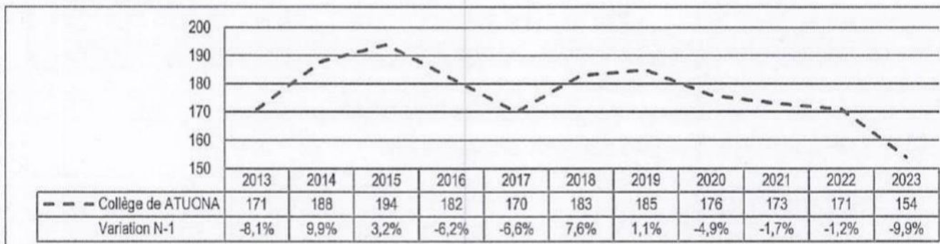
Graphique n° 2 : Effectifs scolaires sur la période 2013-2023