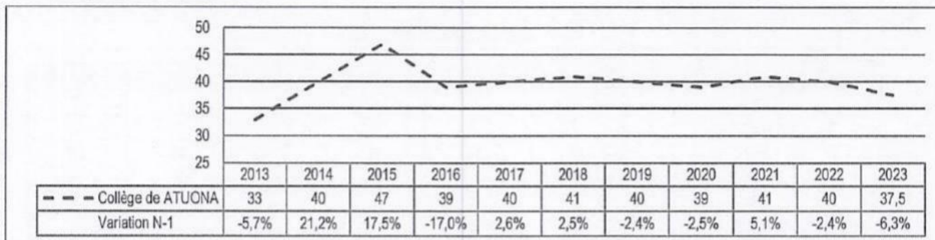
Graphique n° 1 : Effectifs de personnel sur la période 2013-2023